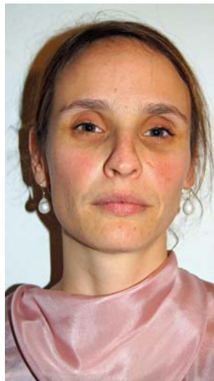
Das Rosa lässt die Haut der Dame unruhig und gerötet erscheinen. Die dunklen Augenringe werden sichtbar.